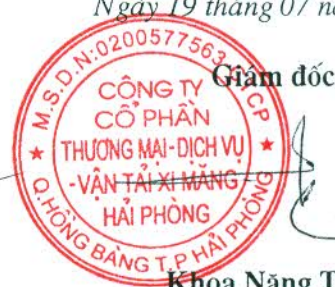
Khoa Năng Tuyên